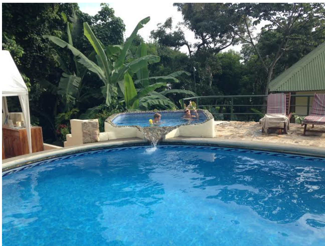
Coin piscine parfait.