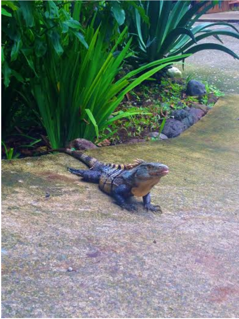
Nos amis sortis du Jurassique