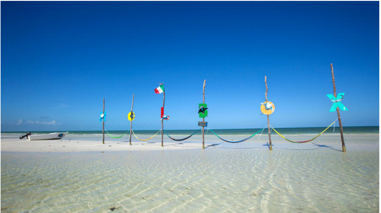
L'île de Holbox, Mexique