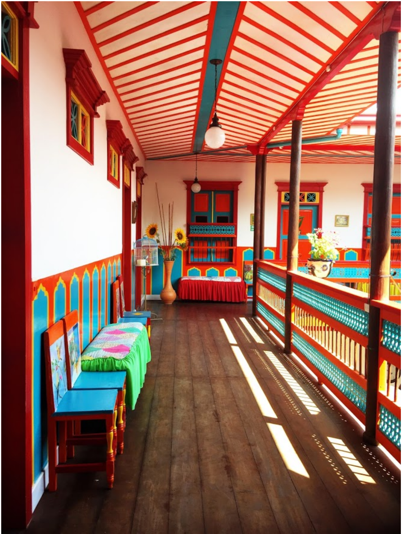
Les maisons colorées de Carthagène, Colombie